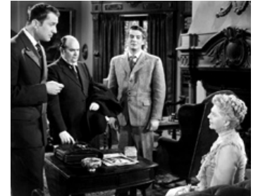
1947 LA ROSE DU CRIME (Moss Rose) de Gregory Ratoff avec Vincent Price, Ethel Barrymore