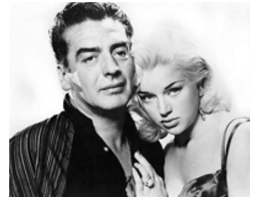
1957 LES TRAFIQUANTS DE LA NUIT (The Long Haul) de Ken Hughes avec Diana Dors