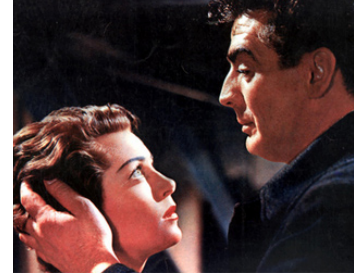
1954 VOYAGE AU-DELÀ DES VIVANTS (Betrayed) de Gottfried Reinhardt avec Lana Turner