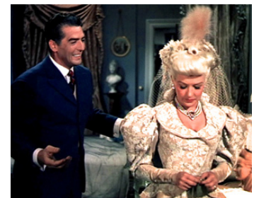
1950 LA RUE DE LA GAÏETÉ (Wabash Avenue) de Henry Koster avec Betty Grable