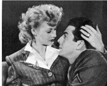
1946 SEVEN DAYS LEAVE de Tim Whelan avec Lucille Ball