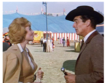
1959 LE CIRQUE FANTASTIQUE (The big Circus) de Joseph Newman avec Rhonda Fleming