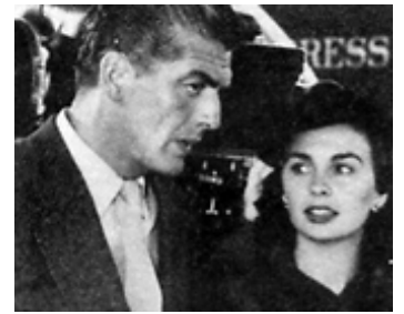
1953 LE RETOUR DE L'AMOUR (Affair with a Stranger) de Roy Rowland avec Jean Simmons