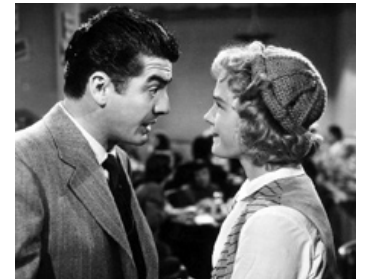
1949 L'ANGE ENDIABLÉ (Red, Hot and Blue) de John Farrow avec Betty Hutton