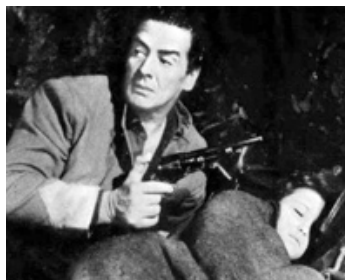
1959 ESCORTE POUR L'ORÉDON (Escort West) de Francis D. Lion avec Elaine Stewart