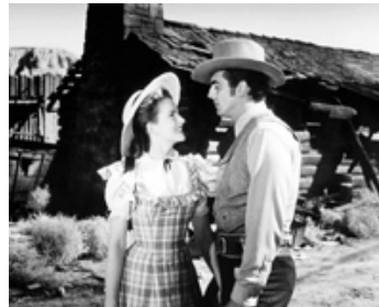
1948 MASSACRE À FURNACE CREEK (Fury at Furnace Creek) de B.Humberstone avec Coleen Gray