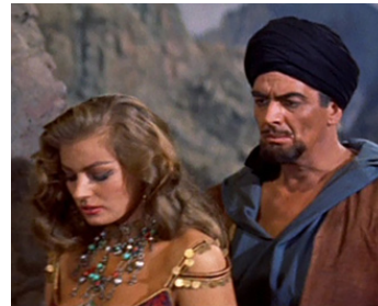
1957 ZARAK LE VALEUREUX (Zarak) de Terence Young avec Anita Ekberg