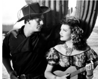
1946 LA POURSUITE INFERNALE (My Darling Clementine) de John Ford avec Linda Darnell