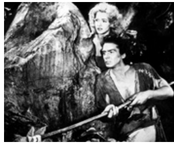
1940 TUMAK, FILS DE LA JUNGLE (One Million B. C.) d'Hal Roach Jr avec Carole Landis