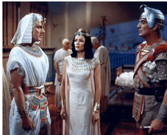
1954 L'ÉGYPTIEN (The Egyptian) de Michael Curtiz avec Michael Wilding, Gene Tierney