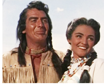
1955 LE GRAND CHEF (Chief Crazy Horse) de George Sherman avec Susan Ball