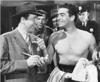
1933 FOOTLIGHT SERENADE de Gregory Ratoff avec John Payne