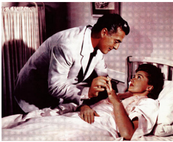
1952 LA PREMIÈRE SIRÈNE (Million Dollar Mermaid) de M. LeRoy avec Esther Williams