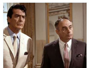
1966 LE RENARD S'ÉVADE À 3 HEURES (Caccia alla volpe) de V. De Sica avec Martin Balsam