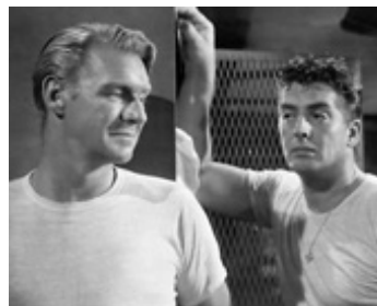
1949 LA VIE FACILE (Easy Living) de Jacques Tourneur avec Sonny Suft