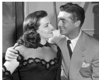
1952 SCANDALE À LAS VEGAS (The Las Vegas Story) de Robert Stevenson avec Jane Russell