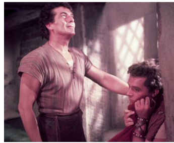
1953 LA TUNIQUE (The Robe) de Henry Koster avec Richard Burton