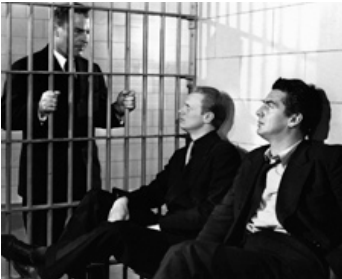
1947 LE CARREFOUR DE LA MORT (Kiss of Death) de Henry Hathaway avec R. Widmark, B. Donlevy