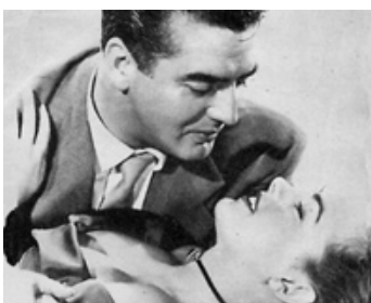
1951 JEUX CLANDESTINS (Gambling House) de Ted Tetzlaff avec Terry-Moore