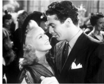
1941 QUI A TUÉ VICKY LYNN ? (I wake up screaming) de Bruce Humberstone avec Betty Grable