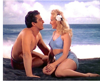
1942 LE CHANT DES ÎLES (Song of the Islands) de Walter Lang avec Betty Grable