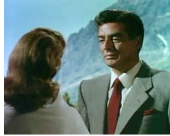
1954 MISSION PÉRILLEUSE (Dangerous Mission) de Louis King avec Piper Laurie