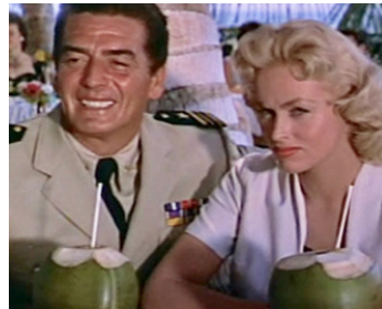
1956 OPÉRATION REQUINS (The Sharkfighters) de Jerry Hopper avec Karen Steele