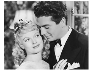
1940 NO, NO NANETTE (No no Nanette) d'Herbert Wilcox avec Anna Neagle