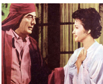
1959 TOMBOUCTOU (Tombuctu) de Jacques Tourneur avec Yvonne de Carlo