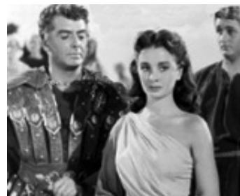
1952 ANDROCLÈS ET LE LION (Androcles and the Lion) de Chester Etskine avec Jean Simmons