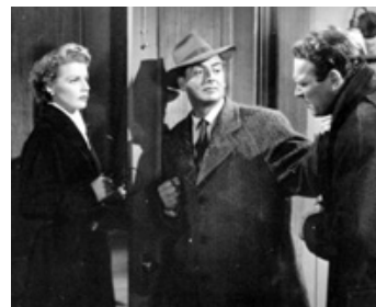
1950 STELLA (Stella) de Claude Binyon avec Ann Sheridan