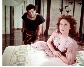
1954 LES GLADIATEURS (Demetrius and the Gladiators) de D. Daves avec Susan Hayward