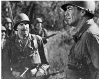
1953 LA GLORIEUSE BRIGADE (The Glory Brigade) de Robert Webb