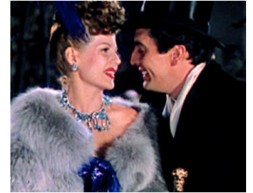
1942 MON AMIE SALLY (My Gal Sal) d'Irving Cummings avec Rita Hayworth