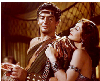
1949 SAMSON ET DALILA (Samson and Delilah) de Cecil B. De Mille avec Heddy Lamarr