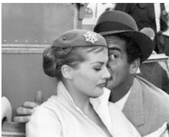
1958 POLICE INTERNATIONALE (Pickup Alley) de John Gilling avec Anita Ekberg