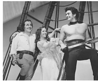
1940 CAPITAINE CASSE-COU (Captain Caution) de R. Wallace avec Leo Carrillo, Louise Platt