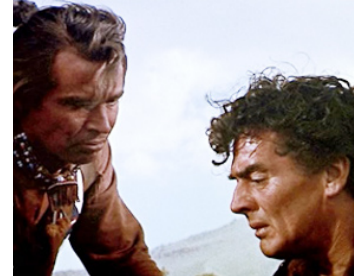
1955 LA CHARGE DES TUNIQUES BLEUES (The Last Frontier) d'Anthony Mann avec Pat Hogan