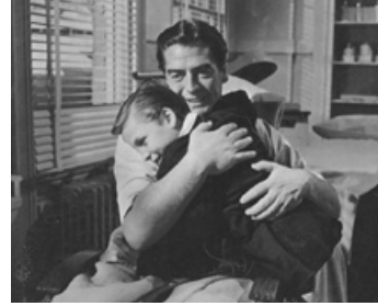
1955 LES INCONNUS DANS LA VILLE (Violent Saturday) de Richard Fleischer