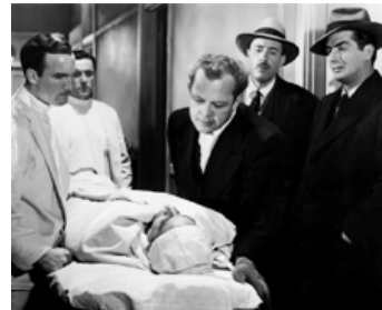
1948 LA PROIE (Cry of the City) de Robert Siodmak avec Fred Clark