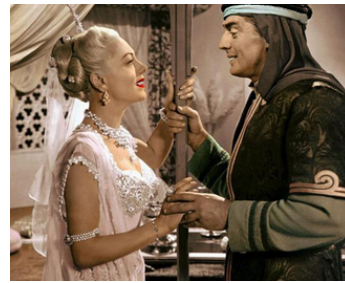
1953 LE PRINCE DE BAGDAD (Veils of Bagdad) de George Sherman avec Mari Blanchard