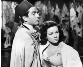
1941 SHANGHAI (Shanghai Gesture) de Joseph von Sternberg avec Gene Tierney