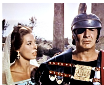
1960 ANNIBAL (Hannibal) de Edgar G. Ulmer avec Rita Gam